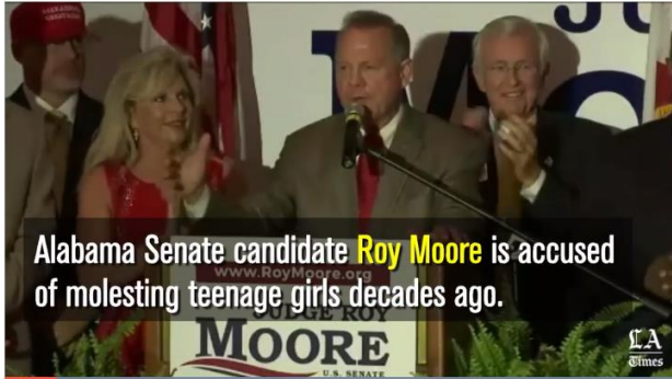
Senate Majority Leader Mitch McConnell (R-Ky.) called on Roy Moore to withdraw from the Dec. 12 special election. (Nov. 14, 2017) (Sign up for our free video newsletter here http://bit.ly/2n6VKPF )